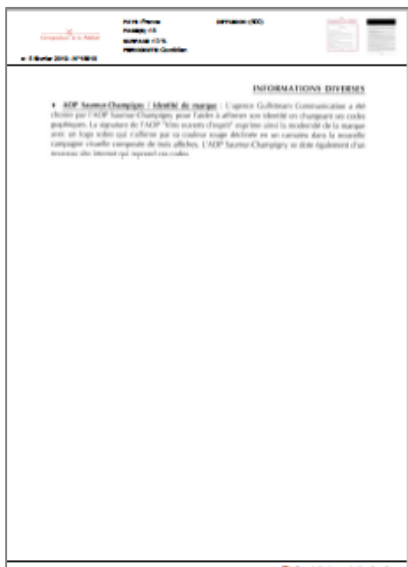
La Correspondance de la Publicité