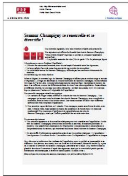
Faire Savoir Faire