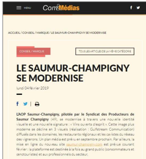
Com & Médias