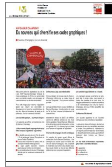
La Revue Agricole